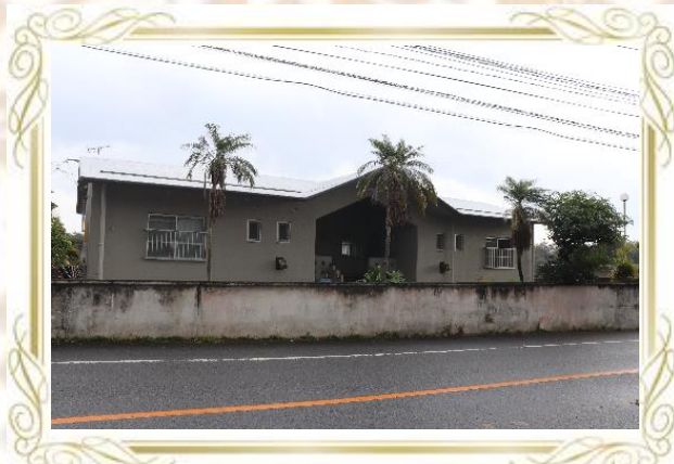
建物外観 (鉄筋コンクリート平屋)