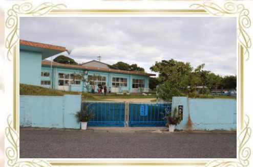
宇宿保育所 (徒歩1分) (園児数28人)