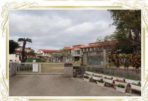
宇宿小学校 (徒歩10分) (児童数34人)