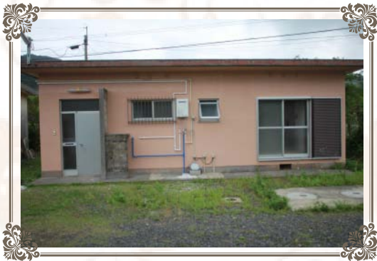
建物外観 （鉄筋コンクリート造平屋）