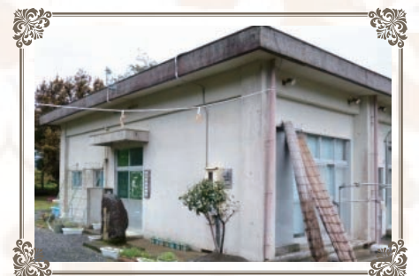
市保育所 （徒歩 2 分） （園児数 4 人）