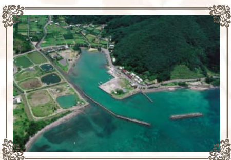
市集落 （人口 153 人）