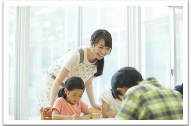
居場所づくりによる地域活性化を目指し、空き教室を活用したアフタースクールの実施