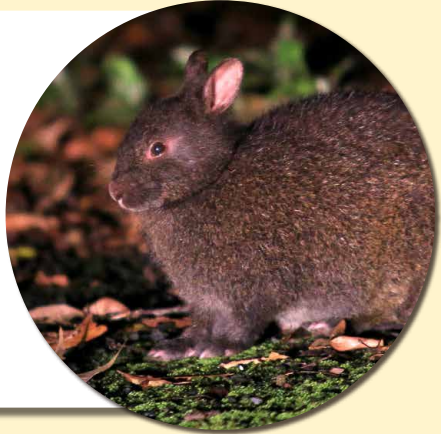
国の特別天然記念物 アマミノクロウサギ