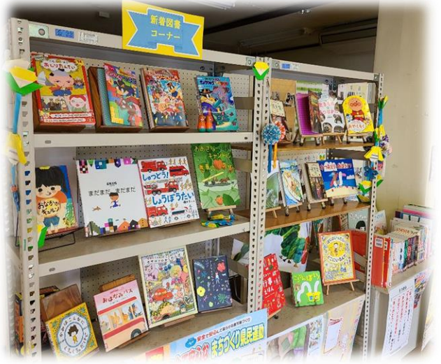
▲学校や市民交流の場の新刊図書コーナー