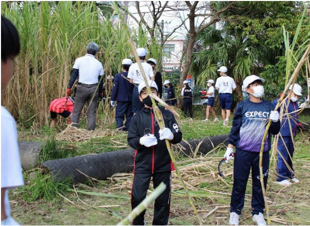
さとうきび刈取体験の様子