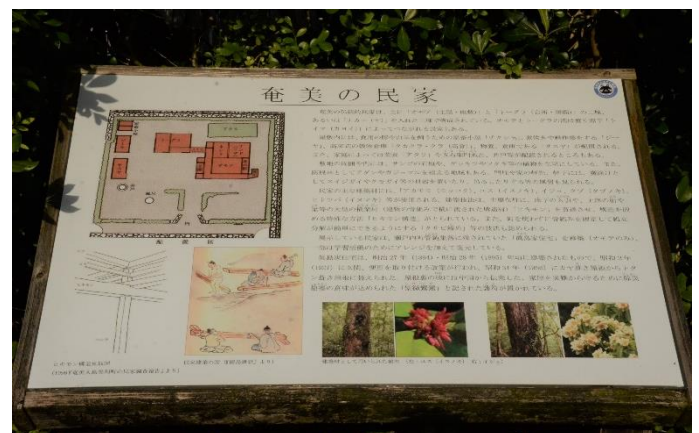
奄美博物館屋外展示「奄美の民家」看板