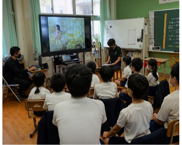
▲電子黒板を使用した授業の様子