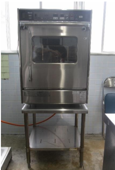
宇宿保育所：ガスコンベクションオープン

幼児期における運動神経・体力向上など、成長を促すための遊具等の整備や、保育施設における環境整備を行いました。