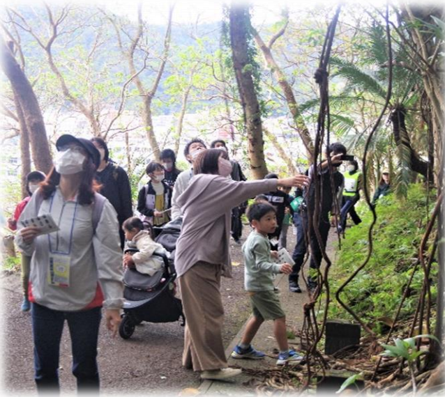
▲家族連れを中心に約140人が参加したハイキングの様子

自らの健康に目を向け、健康づくりをより身近に感じてもらえるよう、民間・事業所・地域・関係機関と一緒に健康づくりを考える『D-1プロジェクト』を立ち上げました。健康づくりに取り組む機会を設け多方面から働きかけることによって、若いころから健康を意識し活力ある生活を送る人を増やし、健康で長寿のシマづくりに取り組んでいます。