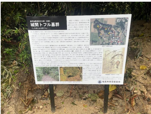
城間トフル墓群看板（2か所）

市内の指定文化財（国指定17件、県指定8件、市指定39件）について市民並びに全国の人へ発信することを目的に、文化財案内板を整備しました。