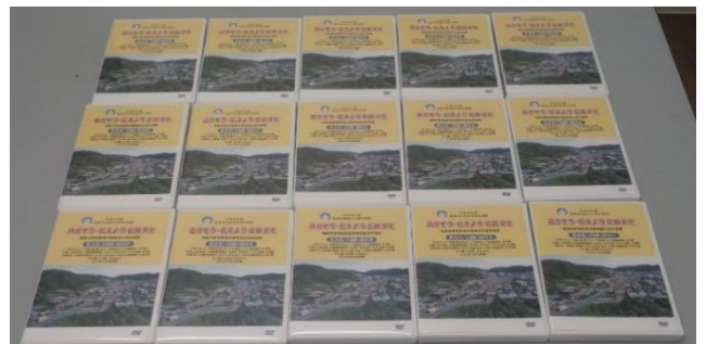
映像をDVDにして保存