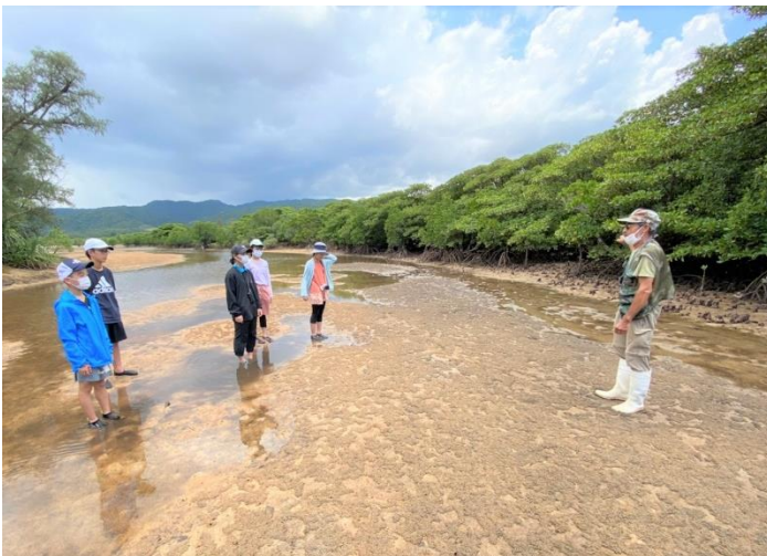
マングローブでのフィールドワーク

奄美市内の小・中学生から選考された児童・生徒が世界自然遺産に登録された奄美大島や沖縄県西表島の動植物や自然環境について、座学やフィールドワークを行い、環境の大切さについて学びました。