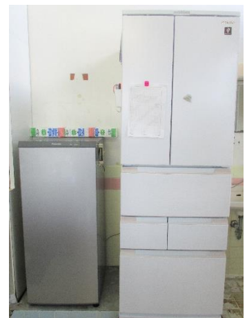
節田保育所：冷蔵庫・冷凍庫