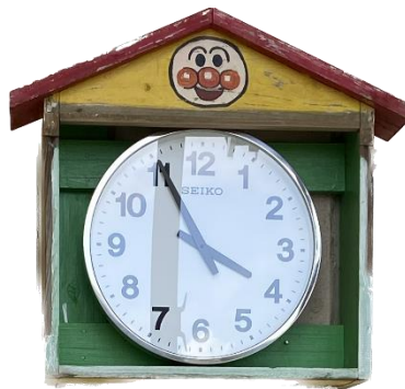
赤木名保育所：屋外時計