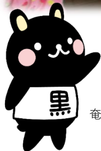
奄美市公式キャラクター コクトくん