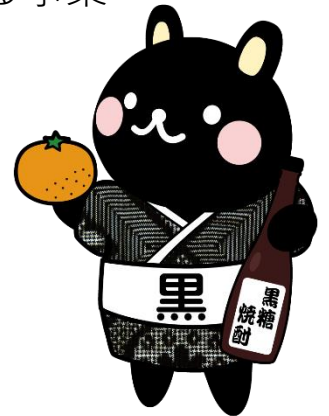
奄美市公式キャラクター コクトくん