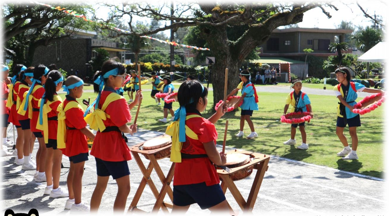
「あまみっ子」ふるさと学習支援事業の様子