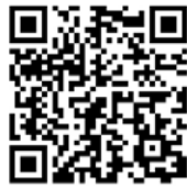
▲生きるを支える相談先一覧