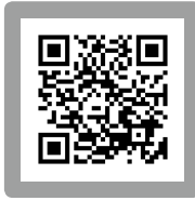
▲インターネットでも応募できます。

■コロナ2回目のワクチンを打つて来たのですが息子が「大丈夫?痛くなかった?ママよく頑張ったね」と注射されたところをさすって心配してくれました。先月就学前の注射を打ったばかりだった。私が息子にした事をそのまま返してくれ