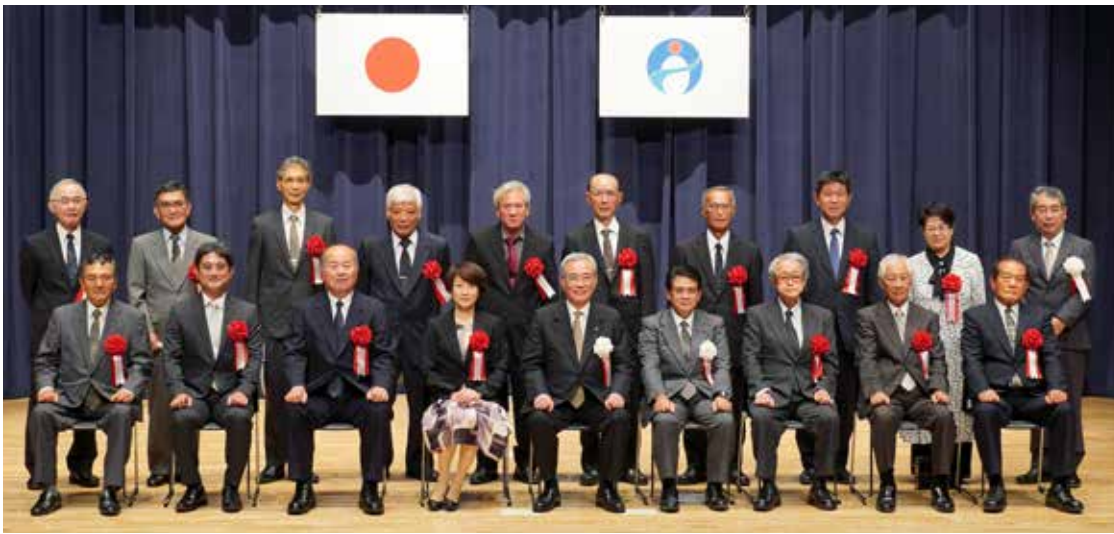
【市政功労表彰者と来賓等】

【奄美市立朝日中学校吹奏楽部】「響明心」笑顔と感謝のハーモニー響け！奄美の海と空へ」をスローガンに、コンテストへの出場、島内の祭りや豊年相撲での演奏、駅伝大会応援等での演奏など、広く活動をしています。今年、念願の全日本吹奏楽コンクール中学校の部に出場。