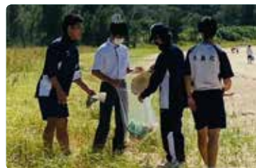
海岸沿いの清掃をする2年生