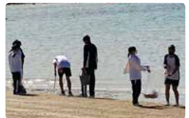
海岸沿いの清掃をする3年生