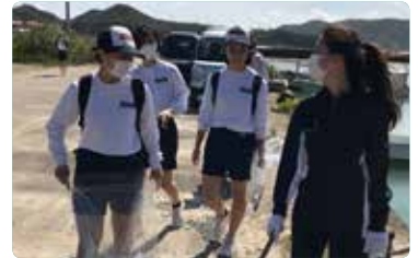
漁港の清掃を行う1年生