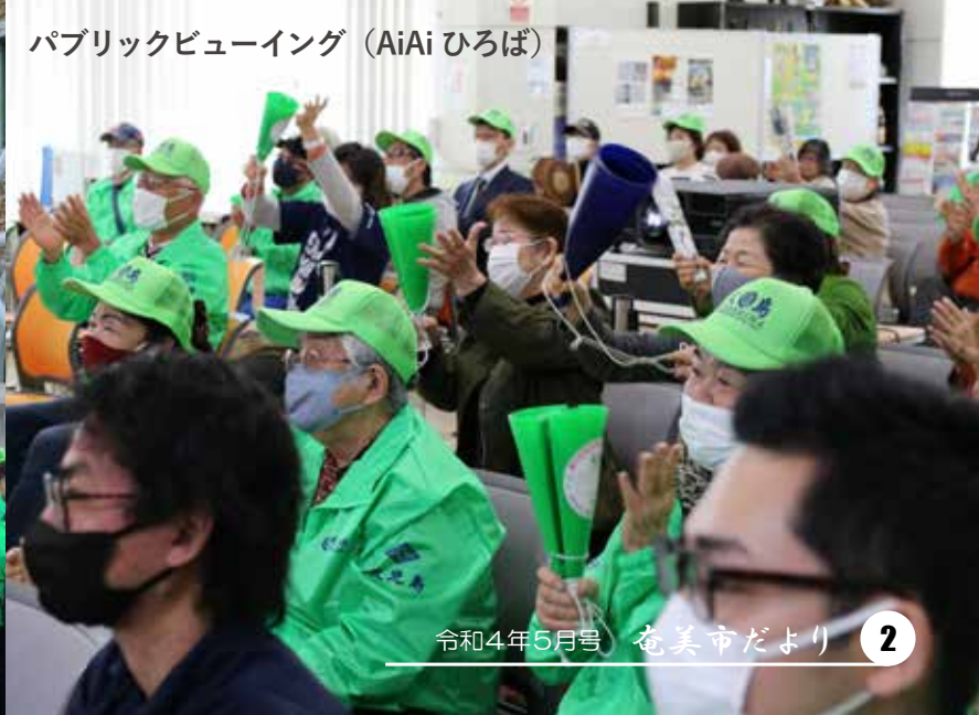
パブリックビューイング（AiAiひろば）