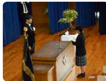
【新入生代表 誓いのことば】