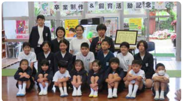
【完成記念での全校写真】