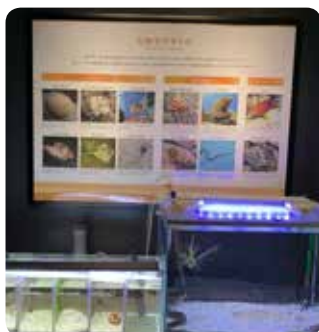
危険な生き物の展示

紹介した生き物以外にも危険な生き物は数多く、展示館ではそれらの展示やおいしく食べられる生き物など多くの生き物を展示しています。ぜひフィールドに行かれる際は一度展示館にきて予習していかれますか？