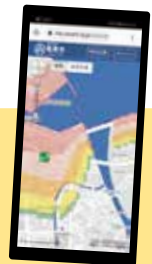
(スマートフォンの表示例)