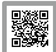
▲インターネットでも応募できます。

にきました。独身で来たのですが昨夏、父になりました。妻と出会わせてくれた奄美大島に感謝です。家族3人、奄美を満喫しています。奄美から異動するまでに家族が何人に増えるか楽しみです。(27歳男性) ■奄美に住み始めて丸4年になります。1歳になる娘を連れて散歩を