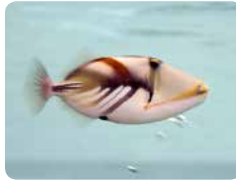
【ムラサメモンガラ】

『フムフムヌクヌクアアア』 まるで呪文のようですが、これはハワイの言葉で「ムラサメモンガラ」という魚の名前を表しています。ハワイの人たちにとっても親しまれている魚で、ぬいぐるみまであるそうです。奄美の海でもよく見られ、展示館では大水槽と個水槽にいます。そのユニークな色合いと泳ぎ方が目を引く愛しい魚です。