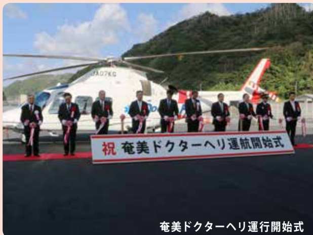
奄美ドクターヘリ運行開始式