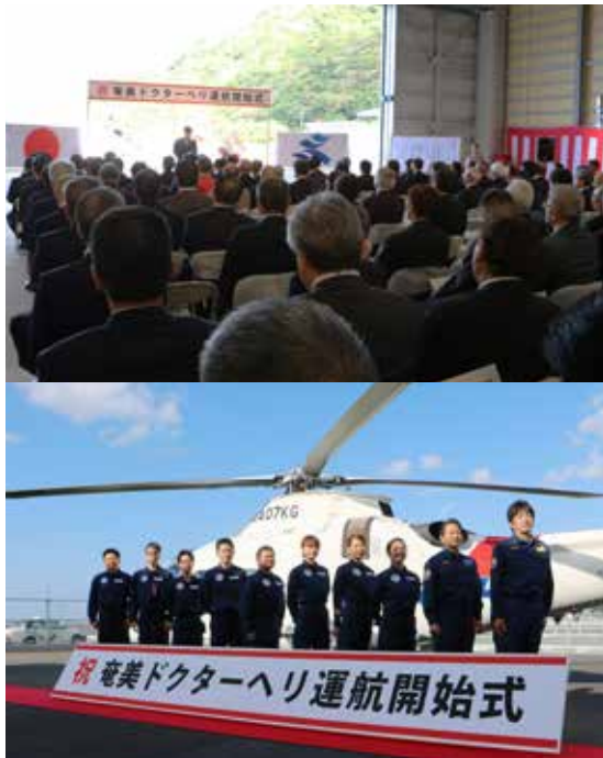
▲ 奄美群島（十島村含む）を運行区域とするドクターヘリの運航開始式が行われました。ドクターヘリでの救急搬送が可能となったことにより、救命率の向上や後遺症の軽減が期待されます。（12月26日）