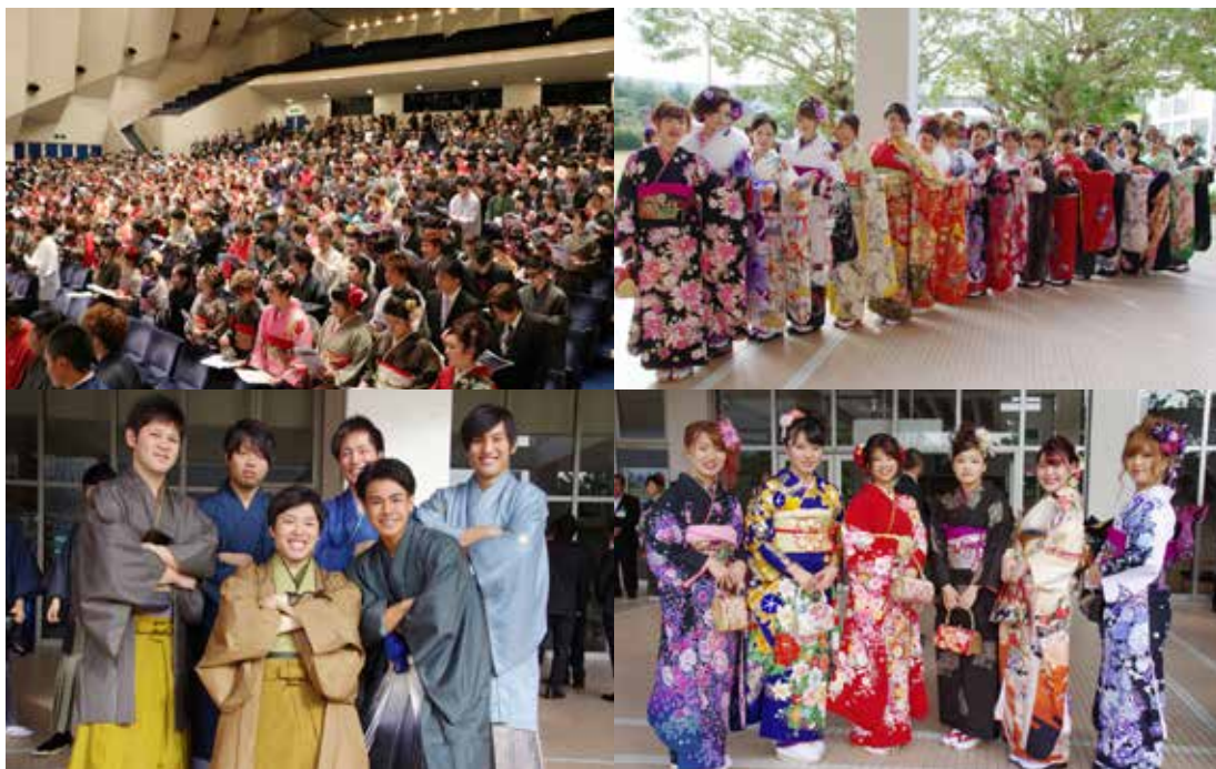
▲「新成人のつどい」が奄美文化センターで行われました。晴れ着を身にまとった新成人 321 人が成人としての第一歩を踏み出しました。また、友人との久しぶりの再会を喜ぶ様子もみられました。（1月5日）