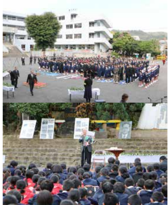
▲ 奄美群島が日本に復帰して63年。「日本復帰記念の日の集い」が名瀬小学校校庭で行われました。小中学生を中心に約500人の参加があり、当時の復帰運動を振り返りました。（12月25日）