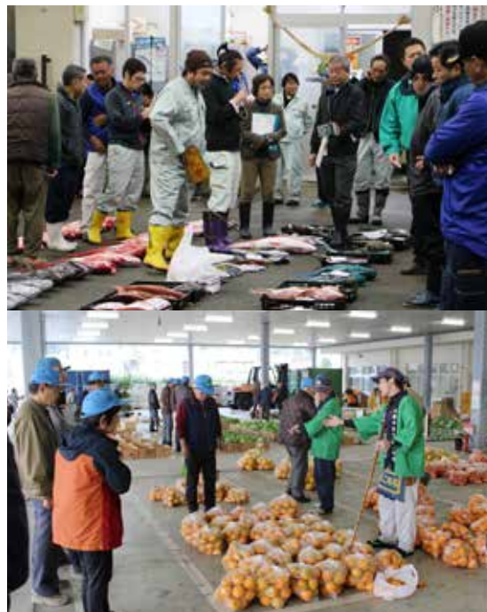
▲ 名瀬漁協と名瀬中央青果で早朝に初競りが行われました。威勢の良い声が響き、今年取引がスタートしました。（1月5日）