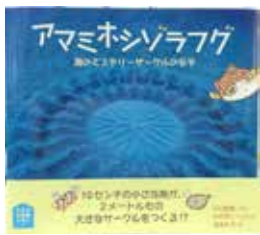
【アヤマシヅラフグ絵本】

展示館にいるフグの仲間、2種を紹介いたします。まず「ミナミハコフグ」。黄色い四角い体に黒い水玉模様のフグです。幼魚のうち黄色いのですが、大きくなると黒い水玉模様の水玉も