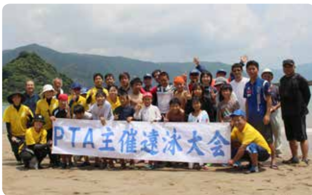
【児童生徒と関係者で記念撮影】