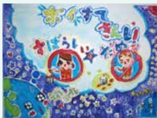
◀佳作 原 知恵（奄美小4年）