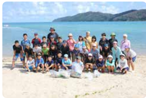
【みんなで記念撮影】