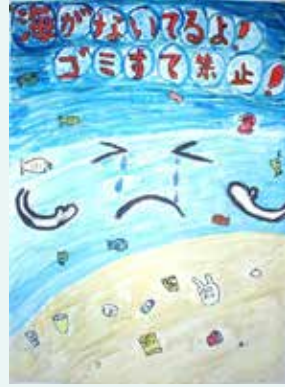
◀優秀 麓 笑幸（奄美小4年）