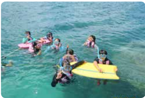
【シュノーケリング】