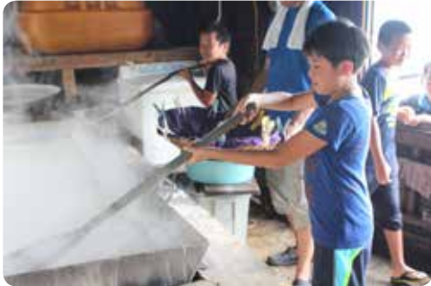
【天然塩づくり体験】

本年度で16回目を迎える、群馬県みなかみ町との交流事業が8月4日(木)から8月8日(月)にかけて行われました。4日午後5時からホストファミリーとの対面式を行い、4泊5日のホームステイが始まりました。滞在中はマリンスポーツ、海水浴、天然塩づくり、お菓子作り等を行い、自由行動の日はホストファミリーと楽しい一日を過ごしました。また、4日はコクトクんとロビンちゃんに迎えられ記念写真を撮りました。来年2月には笠利の子供たちがみなかみ町を訪れます。