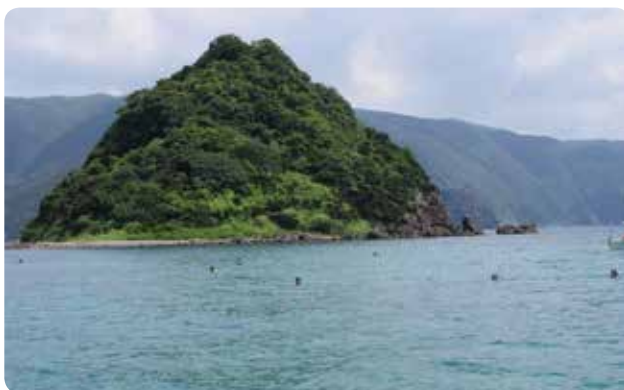
【トビラ島付近を泳ぐ子どもたち】