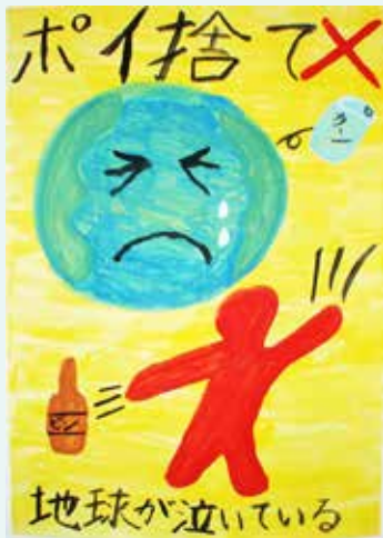
◀最優秀 花田 心優（名瀬小4年）