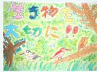
◀佳作 重久 葉奈（奄美小4年）