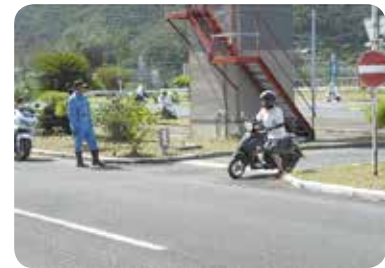
【龍郷自動車学校の実技指導】

【平成28年度 第1回交通安全教室】 7月13日（水）に、今年度第1回目の交通安全教室が行われました。本校では全校生徒112名のうち15名が原付通学の許可を得ており、対象の15名の生徒は龍郷自動車学校の指導教官のもとで本校職員と共に実技講習を受講しました。 また同時に、学校では原付通学者以外の生徒に対しても赤木名駐在所の警察官による講話をして頂きました。 自転車運転時の交通法規や携帯や音楽プレイヤー等によるながら運転などについても具体的にビデオなども交えて指導して頂き、全校生徒が車両を運転する者としての責任