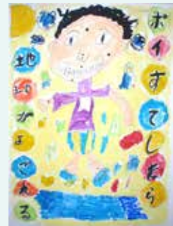
◀佳作 中村 拓人（奄美小4年）