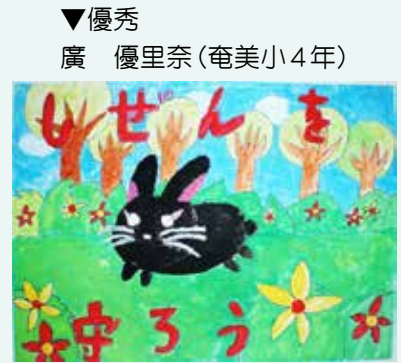
▼優秀 廣 優里奈（奄美小4年）