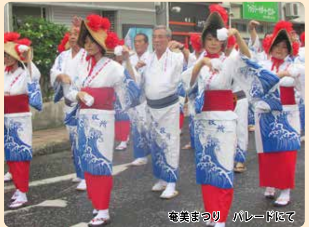
奄美まつり パレードにて