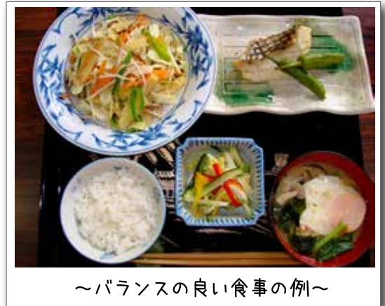
～バランスの良い食事の例～