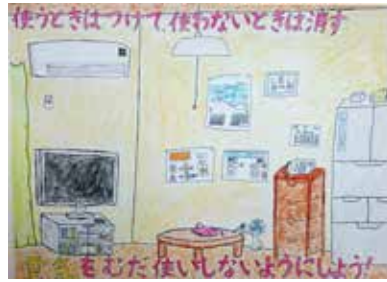
▲佳作 まつぎき しんご (奄美小5年)