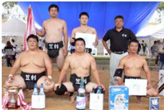
▲A級優勝笠利Aチーム