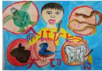
▲佳作 おおくぼ さくら (佐仁小5年)

〈お問い合わせ〉奄美市環境対策課 環境保全係 ☎ 52-1111 (内線1243・1244)