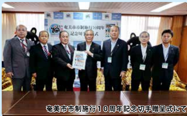
奄美市市制施行10周年記念切手贈呈式にて