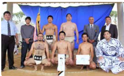
▲B級優勝赤木名Bチーム