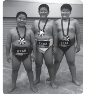
【左から西加くん・濱口くん・榮くん】

2020年東京オリンピックの開催年に、鹿児島では国体が開催されます。奄美市では相撲競技が開催される予定で、その頃高校生である彼らは鹿児島代表を目指して日々頑張っています。