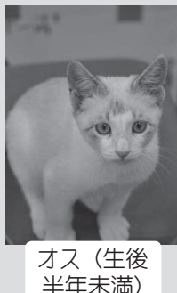
オス(生後半年未満)