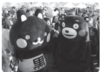
▲有名な、熊本県の「くまモン」と。ボクももっと有名になれるようがんばるのだ!

※広報クイズの抽選で当選された方全員へ、さらにコクトくんのオリジナルマグネットステッカーをプレゼントします。