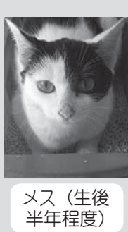
メス(生後半年程度)