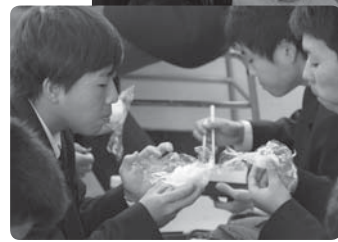
◀おにぎりを味わいながら