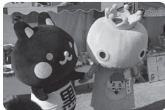
▲奄美市と友好都市である兵庫県西宮市の「みやたん」と。