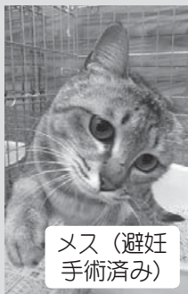
メス(避妊手術済み)