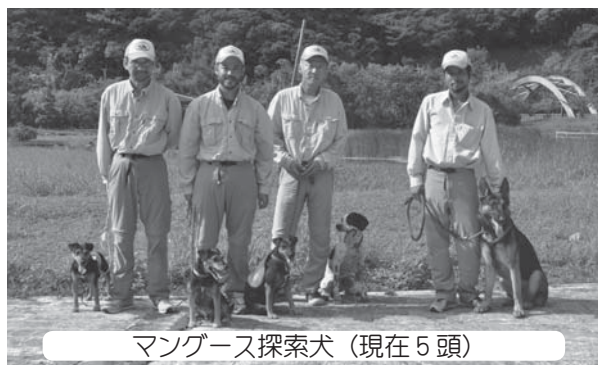
マングース探索犬(現在5頭)