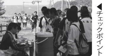
▶さあ出発! ◀チェックポイント