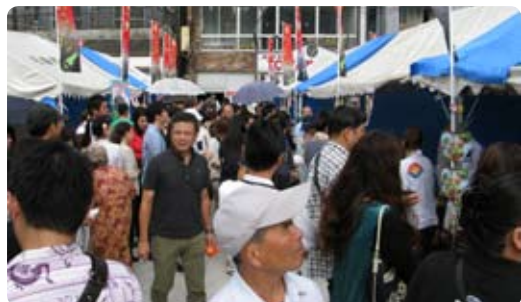
▲商店街秋祭りが開催され、S-1グランプリなど多彩なイベントで盛り上がりました。(11月5日)