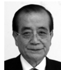
名瀬金久町 自民党・現