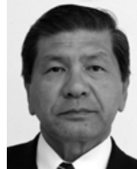
名瀬浦上町 公明党・現