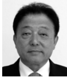
名瀬永田町 自民党・現