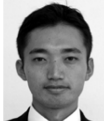
名瀬古田町 無所属・新