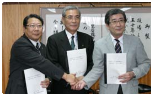
▲災害時における福祉避難所の設置運営に関わる協定が締結されました。(10月20日)