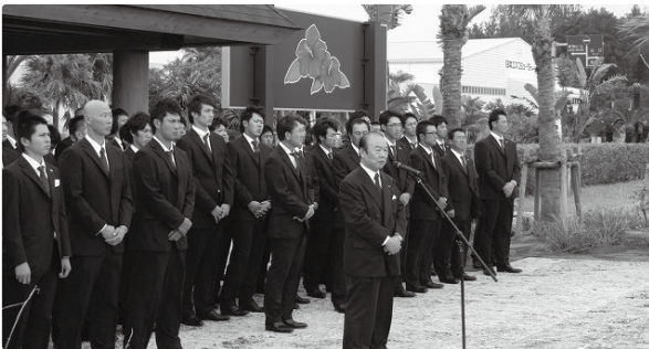
【横浜ベイスターズ秋季キャンプ】