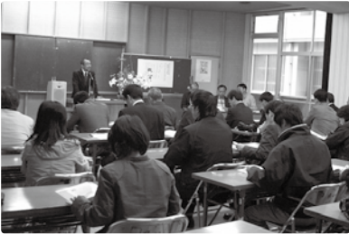
【鹿児島大学大学院島嶼コース開設】