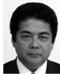
名瀬金久町 公明党・現