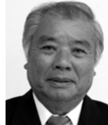
名瀬小宿 無所属・新