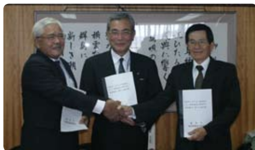
▲奄美漁協・名瀬漁協との災害応援協定調印式が行われました。(10月20日)