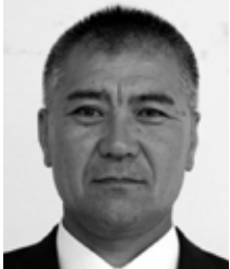
笠利町節田 無所属・現