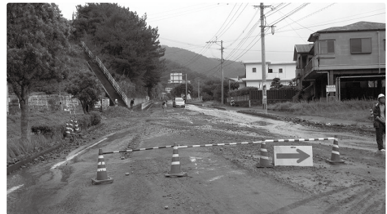
【奄美大島北部豪雨災害】