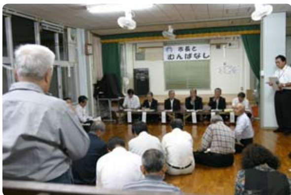
▲小俣町内会にて「市長とむんばなし」が開催されました。(11月9日)