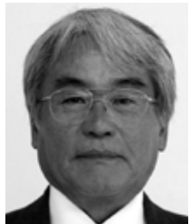
名瀬浦上町 無所属・新