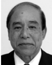
名瀬長浜町 無所属・新