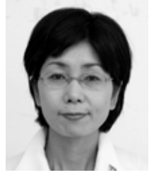
名瀬長浜町 公明党・新