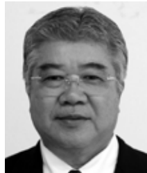
住用町山間 無所属・現