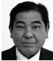
名瀬長浜町 公明党・現