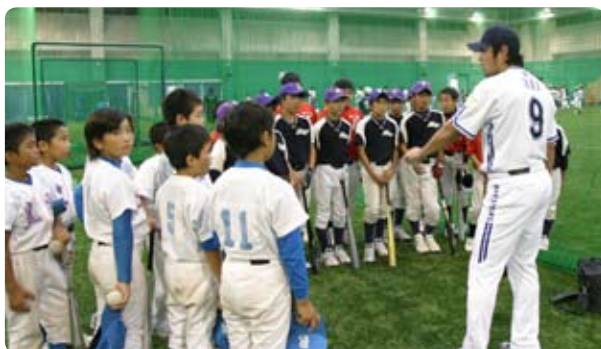
▲横浜ベイスターズへの記念品贈呈が行われ、少年野球教室も開催されました。(11月5日)

申し込み・お問い合わせ先 市民協働推進課 電話 52-1111 (内線 1736、1737)