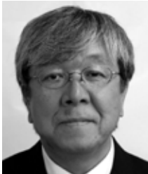
名瀬浜里町 社民党・現