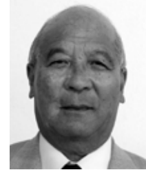
名瀬長浜町 無所属・現