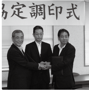
【空想科学(株)との立地協定】