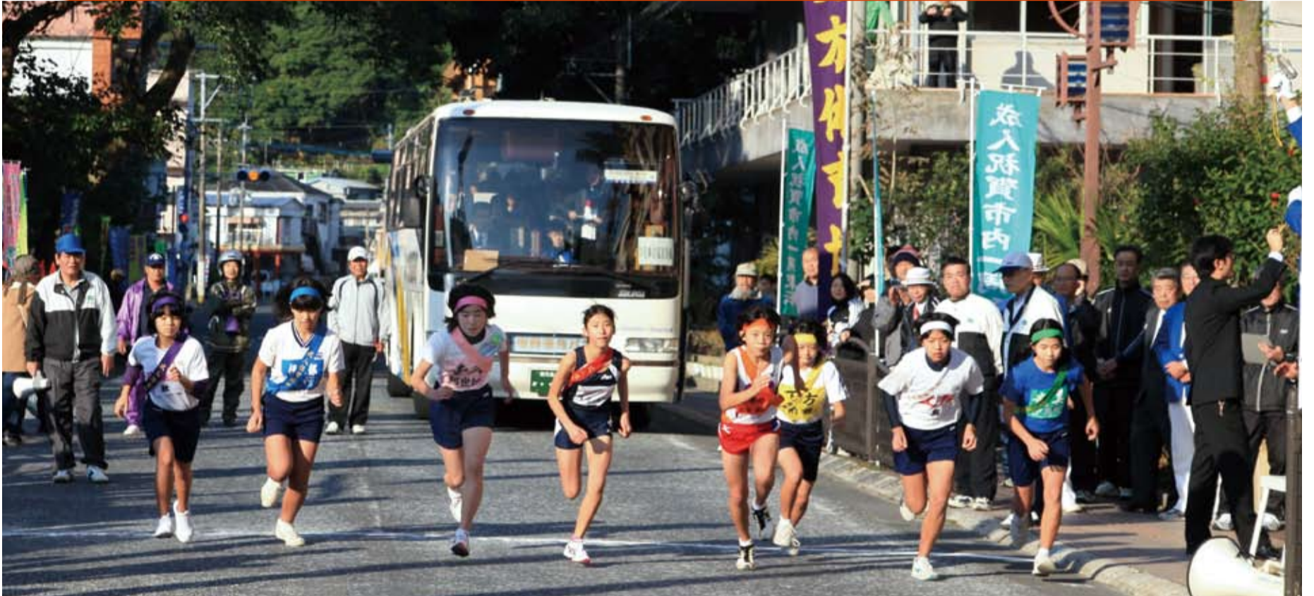
1月10日(日)、成人祝賀地区対抗駅伝大会が開催されました。快晴の青空の下、各地区の選手たちは奄美市内を颯爽と駆け抜けていました。