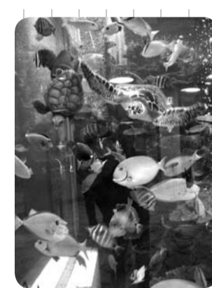
エサに群がる魚たち

アヤビキ 日記 食べっぶりグランプリ 本格的な寒さがやってきました。体調はいかがでしょうか？体調管理には食事が大切です。海産物の魚やカメ、洋産物の魚やカメ、たちも寒さに負けず、いっぱいエサ(オキアミ、キリナゴ、レタス)を食べて元気に泳ぎ回っています。 エサは通常一日一回大水槽の上の方から投げ入れますが、エサの時間になると魚たちはソワソワとじりじり、職員が階段をのぼり始める。一斉に群がり、職員を追い回すように泳いでいます。その魚群は見たえ十分です。 その食べっぶりの見事な魚たちですが、ここで魚たち(海洋展示館限定)の食べっぶりトップ3を発表したいと思います。 第三位は イヌスミです。方言で『シチ』といえど、ばかかな？体長約50cmと大きく、エサの時間になると激しく動くため、何度か水をこぼしたことがあります。 第二位は オシサンです。方言では『カタヤス』といいますが、オシサンという名前なのに非常に動きも早く、エサに飛びつくとジャンプするところも