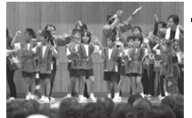
【笠利わらべ島唄クラブ】