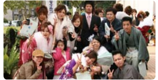
↑1月5日、奄美文化センターで開催されました。