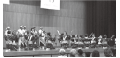
【用シュンカネツァ】