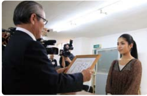
109人目の観光大使に任命されました。