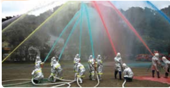
1月6日(水)、伊津部小学校校庭で開催されました。※本紙5ページに消防団員表彰者を掲載しています。