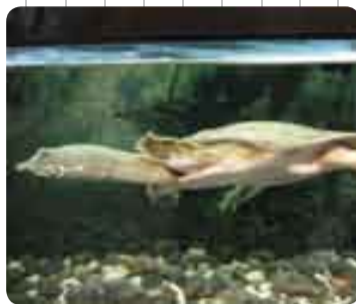
首の長〜いスッポン

海洋展示館では海の生物だけではなく、川の生物も展示しているのはご存知でしょうか。テナガエビ(方言ではオナガ)やアマミシリケンイモリ(チョウチンソウ)やスッポン、ミシシッピアカミミガメ(いわゆるミドリガメ)も展示しております。このスッポン、ミシシッピアカミミガメは奄美市内で発見され当館で展示することになりました。 外来種は貨物などにまぎれて意図せず侵入してきたものや、何らかの目的を持って人間が意図的に移入したものがあります。一般に繁殖力や適応力が強く、固有種などが絶滅の危機にさらされる危険性があります。その代表的な例がマンブラスヤフラックバスです。これらには罪はありませんが、悪者扱いされて少しかわいそうなくもしますね... 当館で展示しているミシシッピアカミミガメはペットで飼われていて、その後自然界に放たれた可能性がります。皆さんがペットなどを飼われる時には責任を持ちます。