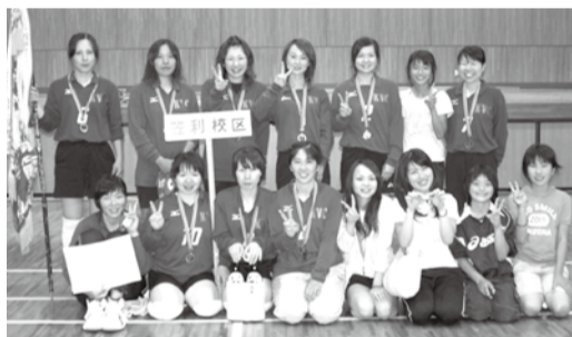
【女子優勝笠利チーム】