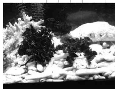
変装名人あらわる

・大水槽給餌(きゅらじ)見学:大水槽の魚たちに職員がエサを与えます。たくさん釣る魚やカメたちがいっせいに集まってエサにかぶりつく様子はビックリですよ。(毎日午前11時・午後4時に実施予定、見学無料) ・貝から細工、キーホルダー作成、砂絵、海藻しおり:自分だけのオリジナル作品を作ることができます。夏休みの工作にもってこいです。(随時受け付け、有料) ね、楽しんで夏休みのうち1日は歩いてきたら大浜でゆっくり遊びましょう! 突然ですがこのフェイスです。この画像にはある生き物がかくれています。とてもかかれませんが上手になかなか見つけるのが難しいと思います。がチャレンジしてください。 正解は・・・海洋展示館に来てからのお楽しみですよ 奄美海洋展示館 55-6000