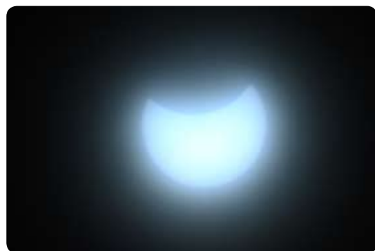
【欠けていく太陽（部分日食）】