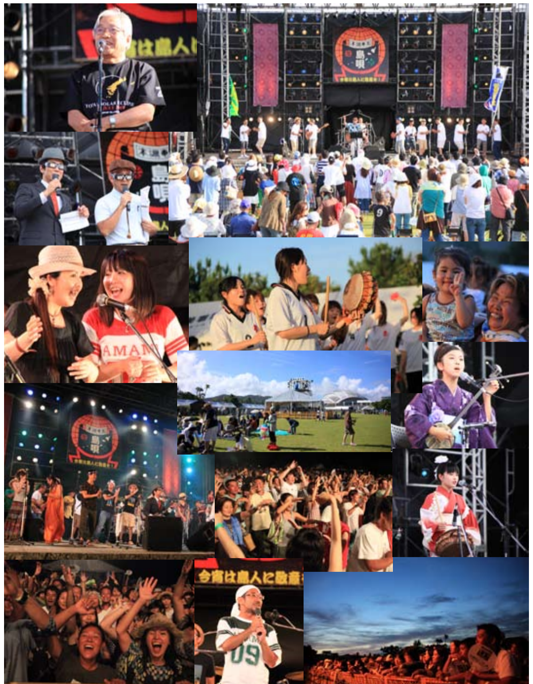
夜ネヤ、島ンチュ、リスぺクチュツ!! 7月18日、19日 奄美パーク