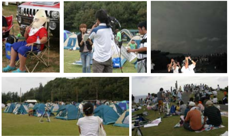
多くの観測者が訪れたあやまる岬