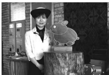
奄美パークに設置された募金箱

奄美空港に設置されたクロウサギのモチーフがついた募金箱。7月5日(日)に除幕式が行われました。