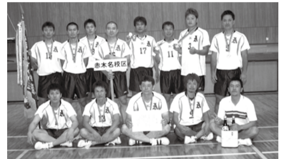
【男子A級優勝赤木名Aチーム】