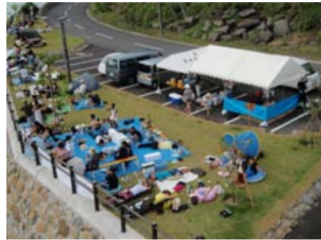
奄美最北端となる笠利崎灯台周辺