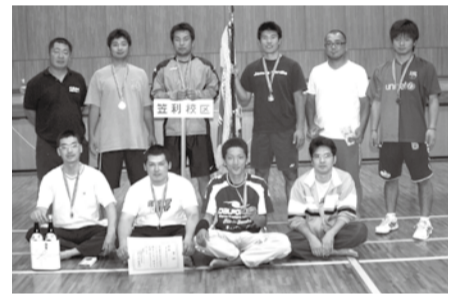
【男子B級優勝笠利Bチーム】