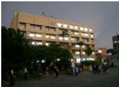
奄美市役所も皆既日食の影で覆われる