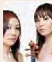
ヴァイオリン・デュオ/ デュオ・プリマ