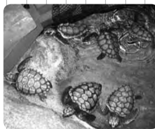
「大きくなったぼくたちを見てね」（8月5日生のカメさんより）

には、例年4月下旬から7月いっぱい間に、約30〜40頭のウミガメ（アカウミガメ、アオウミガメ）が産卵にやってきました。今年5月3日に今シーズン第1号のアカウミガメが産卵し、17個の卵を確認しました。ウミガメの卵はピンポン玉くらい大きさで、1回の産卵で100個〜150個産みます。40日〜60日でふ化し、大海原へと旅立っていきませんが、その子ガメが成長し大人になる確率は5千分の1とも言われており、非常に低い生存率となっています。少しでも多くのウミガメに産卵・ふ化・成長してもらうためには、皆様の協力が必要となりますので、次の点に注意して