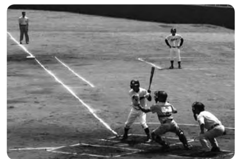
【野球部対抗戦(奄美市民球場)】