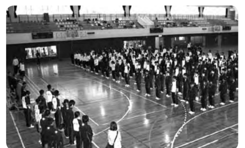
【開会式(奄美市総合体育館)】