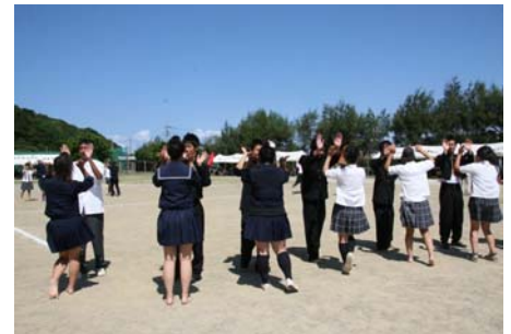
3年生のフォークダンス