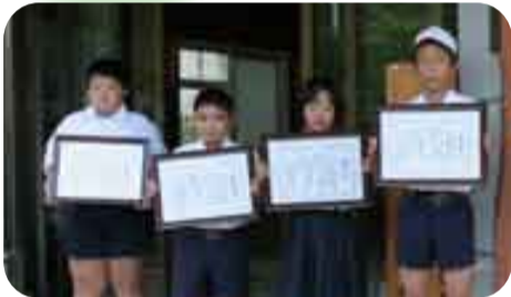
【優秀スポーツ選手表彰受賞の子供たち】

各種スポーツ競技において優秀な成績(過去1年間で県の大会優勝以上)を収めた選手のうち、住用地区選手の表彰式が、8月29日(水)に、住用総合支所にて行われました。表彰を受けられた皆様おめでとうございます。今後ますますのご活躍を期待いたします。優秀選手は次のとおりです。