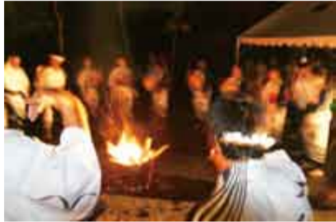
【大熊青壮年団による八月踊り】