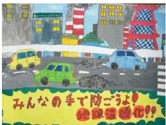
（ポスターの部・井上さんの作品）