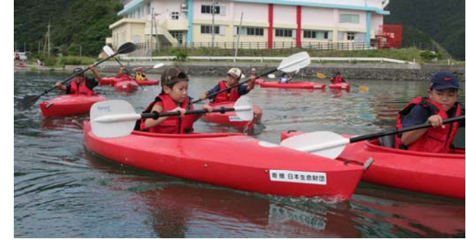
(カヌーにもすぐ慣れ、うまく漕ぎ出す子供たち)

8月29日(水)～30日(木)に、奄美市内の児童・生徒が参加し、住用町でカヌー体験や川の生き物観察などの自然体験学習が行われました。 今回の自然体験学習は、「ふるさと奄美塾」を初めて三地区合同で開催したもので、自然体験を通じ、奄美市内の子供たちが地域の素晴らしさを認識するとともに、他校・他学年の児童・生徒との交流を深めていました。