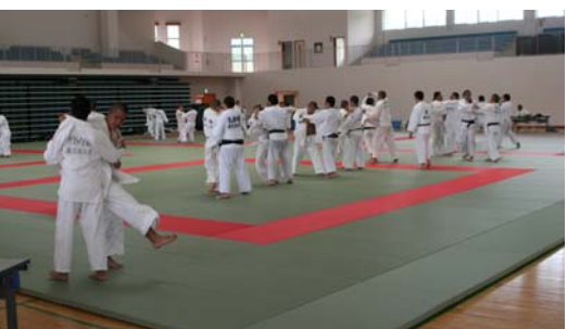
(奄美体験交流館で行われた奄美大島中・高合同強化合宿)

8月16日(金)～20日(月)に、奄美体験交流館で「奄美大島中・高合同強化合宿」が行われた。この合宿は、11月下旬に同交流館で開催予定の「九州高校新人柔道大会」のリハーサルも兼ねたものであり、県本土から鹿児島工業高校が、奄美群島内から高校4校・中学校6校が参加して行われました。