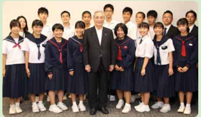
ナカドウチェス交換留学生報告会