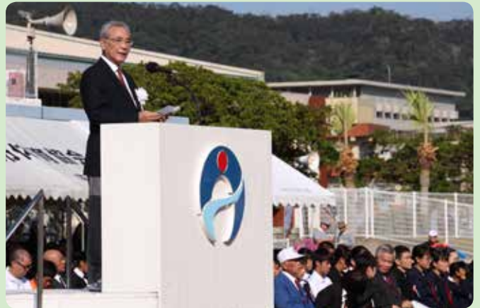
第12回奄美市民体育祭