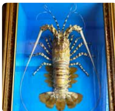
【ニシキエビのはく製】

南西諸島など暖かい海にすみ、肉食性で貝類やフニ、他の甲殻類などを食べます。夜行性なので昼間は岩陰でじっとしていることが多いのですが、人の気配を感じると、50cm以上はあんな長い触覚を威嚇するかのように揺らします。残念ながら、この個体は触覚が1本折れてなくなっていますが、それでも今のところは生きていくのに支障はないようです。エサはキビナゴを数尾あげていますが、エサの気配を感じると、じりじりと体を見せてきて、五対の足で素早く抱え込み、また岩陰に戻ります。大きさにも圧倒されますが、その動きも、人間の想像を超えた不思議な生き物のようで見飽きません。海の生き物の面白さを感じることのできる巨大ニシキエビ、ぜひ見に来てほしいですね。