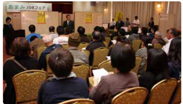
▶「あまみ島暮らしフェア 2019」として、女性向け就活イベント「ジョブカフェ」や移住相談会、地元求職者・UIターナー向け「あまみ JOB フェア」が開催され、各イベントに多くの地元企業や求職者が参加しました。(11月14日)