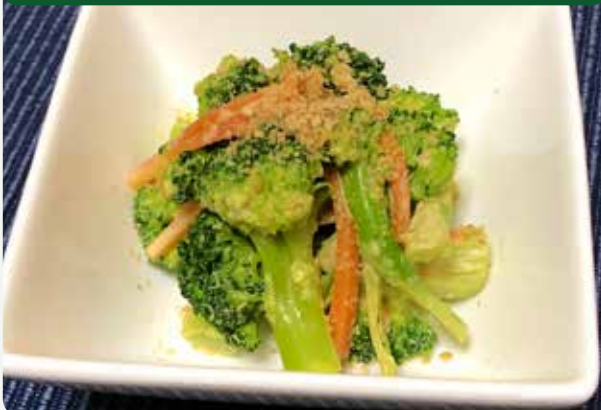
メニュー考案：名瀬保健所管内行政栄養士連絡会