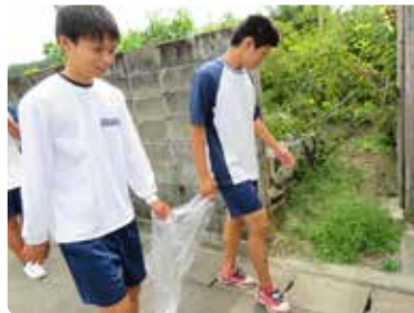
◀海岸までの道中もゴミを拾いました