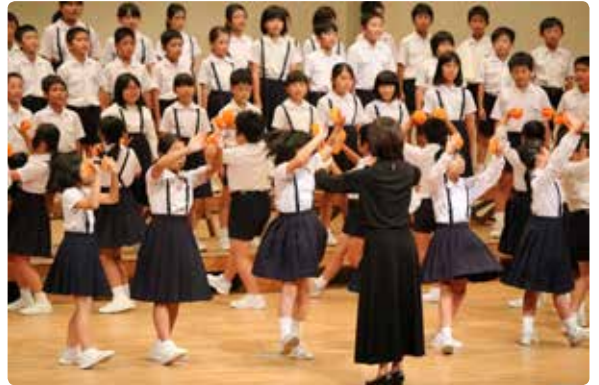
▶奄美市小中学校音楽発表会が奄美文化センター(名瀬・住用)と笠利農村環境改善センター(笠利)で開催され、多彩な演目で会場を魅了しました。(11月13日)