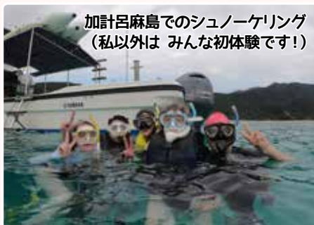
加計呂麻島でのシュノーケリング (私以外は みんな初体験です!)

旅行をしました。シノーケリングをしたり、居酒屋で黒糖焼酎を飲んだり、夜にパーベキューしたり、そして島人と交流したりと奄美ならではの