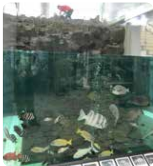
【水を抜いています】

展示館の大水槽は、高さ5m、幅5m、奥行き約10m、海水の容量が約150トンあります。週1回、ダイバーさんが潜って汚れやコケを落とす掃除をします。それでも少しずつ汚れが溜まっていくので、年に2回、魚を移動し水を全部抜いて、大掃除を行います。その日は休館にして職員総出で作業します。 まずはウミガメたちから予備水槽へ移動します。日頃からエサをあげると近寄ってきてくれるので、捕まえるのはそう大変ではありません。それから水を抜いていきます。徐々に水が減っていくと、水中にあった疑似サンゴや岩が顔を出し、独特の磯臭いにおいが漂います。魚たちもいつもより泳ぐ場所が狭くなっていくのに、落ち着きなく泳ぎ回ります。水がないと水槽全体が狭く感じます。また水の反射でガラス越しには見えなかった景色も見えるようになってきます。