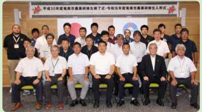
奄美市農業研修生 卒業式・入学式