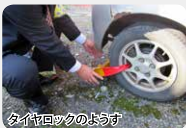
タイヤロックのようす

毎年8月・12月は「県下一斉国保税滞納整理強化月間」となっており、国保税の徴収強化に取り組みます。