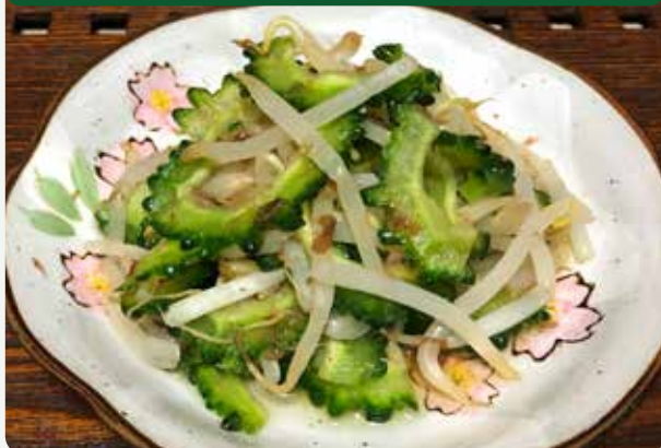
メニュー考案：名瀬保健所管内行政栄養士連絡会