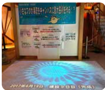
【アマミホシゾラフグ展示】

4月から新生活が始まった方も多いのではないのでしょうか。今回は展示館の基本情報をお知らせします。 奄美海洋展示館は名瀬地区の大浜海浜公園内にあります。「海と人との共生」をテーマに、奄美の海の生き物を飼育・展示しており、また人々の生活と海との関わりについても学べる施設です。 入口すべには、高さ5メートル、幅5メートルの大水槽があり、島の人たちに馴染みの深い魚たちが泳いでいます。このコラムのタイトルにもなっているアヤビキ(島の方言でオヤビツチャといふスズメダイの仲間のこと)、口の下のヒゲが特徴的なオシサン(図鑑に載っている正式な和名です)、派手な模様でちよこまかと泳ぎ回るミラサメモンガラ、アクリル面に小判型の吸盤で張り付いているコバンザメなど、見ている飽きません。