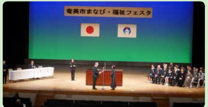
奄美市まなび・福祉フェスタ