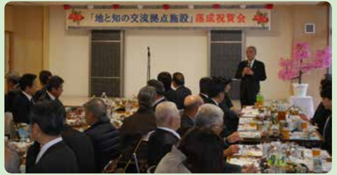
奄美市地と知の交流拠点施設（名瀬安勝町）落成祝賀会