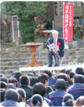
復帰記念の日のつどい