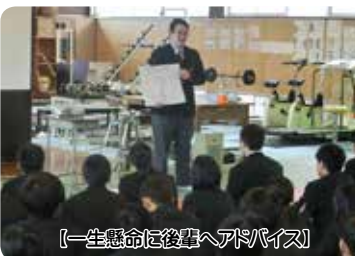
【一生涯懸命に仕事へアドバイス】

2月13日(水)就職・進学試験を無事突破して卒業を控える3年生が1・2年生の後輩へ自身の進路体験を発表しました。1・2年生はフリップやパワーポイントを利用した発表に聞き入り、必死にメモを取っていました。先輩たちのアドバイスを自分のものにして、それぞれの進路決定に役立ててほしいと思います。