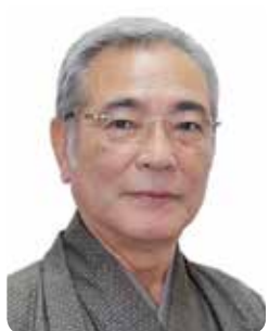
奄美市長 朝山 毅

奄美市の振興、奄美群島の自立的発展、そして誇りと幸せに満ちた島の実現に向けて、市民の皆様、そして議会の皆様のお力添えを賜りながら、関係機関と連携して取組んでまいることをお誓い申し上げます。