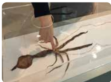
【さわれます! プラスチネーション標本】

珍しいイカなので、大学の研究室へ提供する話もあったのですが、せっかく奄美の方が奄美で捕獲した個体なので、なんとか皆さんに見てもらえるように展示できないかと考え、プラスチックネーション標本を作成することにしました。プラスチックネーションとは、生物の水分や脂肪分を合成樹脂と置き換えることで、生きている時の姿や触感を残し、なおかつ触ることもできる標本です。これまでの標本はホルマリンなどの液体に漬けるのが一般的で、どうしても小さな容器に詰め込むような形になり、もちろん触ることはできませんでした。画期的な新技術で、約5か月をかけて作成されたユウレイイカのプラスチックネーション標本をいよいよ展示します。ユウレイイカの不思議な形をそのままに見て、触れて、海の生き物の面白さを感じて下さいね。