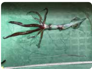
【捕獲直後のユウレイイカ】

太陽の光が届かない深海。暗闇の中、ほのかな光を発する生物がゆらゆらと泳いでいる…。そんな世界を想像させる生き物がやってきました。その名も「ユウレイイカ」です。平成29年10月、地元の方が「30年イカ釣りをしているけれど、こんなイカは見たことがない」と釣上げたものを持ってきてくださいました。残念ながら生きてはいなかったのですが、なかなか出会えることのない珍しいイカの姿は興味深いものでした。