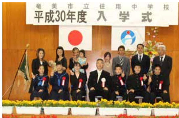
▲本年度は、男子3名、女子2名、計5名の新入生が入学しました。緊張した面持ちで入場してきたニューフェイスたちでしたが、大きな元気のよい返事や落ち着いた誓いの言葉に、頼もしさを感じました。