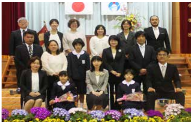
▲2名のかわいい1年生が仲間入りしました。大きな声であいさつをすることもできました。色々なことに興味をもち、様々な体験を経て、大きく成長する姿を地域と共に温かく見守りたいですね。