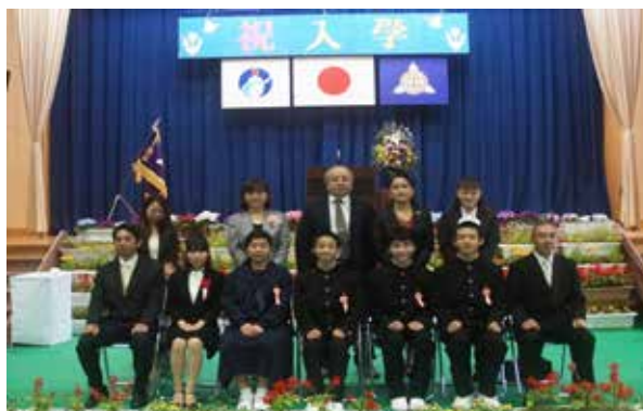
▲第71回入学式が行われ、小学校の新入生2名、中学校の新入生4名が元気に入学しました。入学式では、在校生は元気よく歌や代表の言葉で歓迎し、入学生は最後までうれしそうに笑顔が絶えない様子でした。