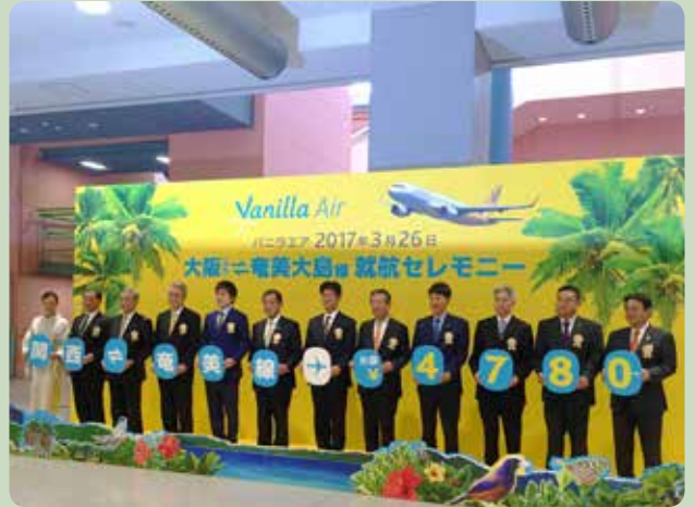
パニラエア関西-奄美間就航セレモニー