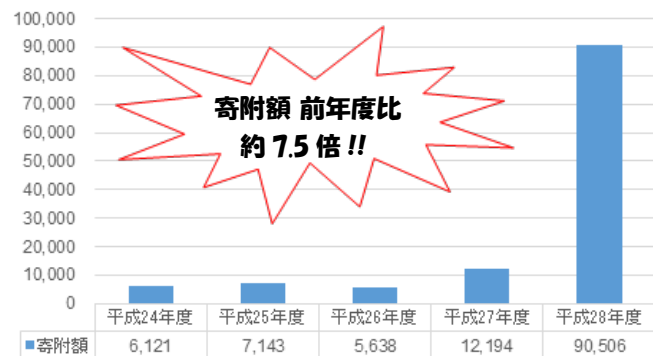
奄美市ふるさと納税寄付額推移（千円）

平成28年度は皆様より、 2,896件、90,506,689円 のご寄附をいただきました。ご寄附いただいた皆様への感謝を忘れず、奄美市の発展のためさまざまな事業に活用いたします。引き続き、応援よろしく申し上げます！