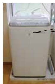
▲洗濯機(山間集落会)

宝くじの社会貢献広報事業で、宝くじの受託事業収入を財源としています。地域住民が行うコミュニティ活動に直接必要な備品等の整備に対して助成を行い、コミュニティ活動の促進、自治意識の向上を図るものです。