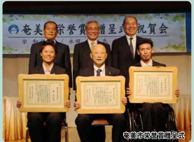
奄美市栄誉賞贈呈式