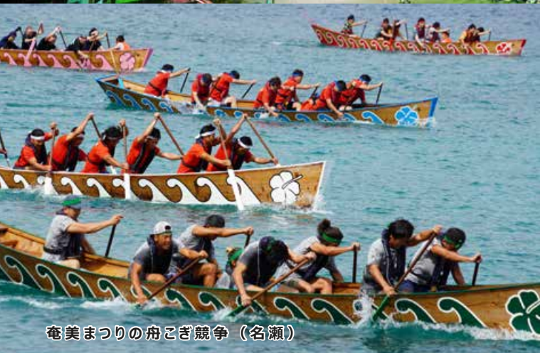
奄美まつりの舟こぎ競争（名瀬）