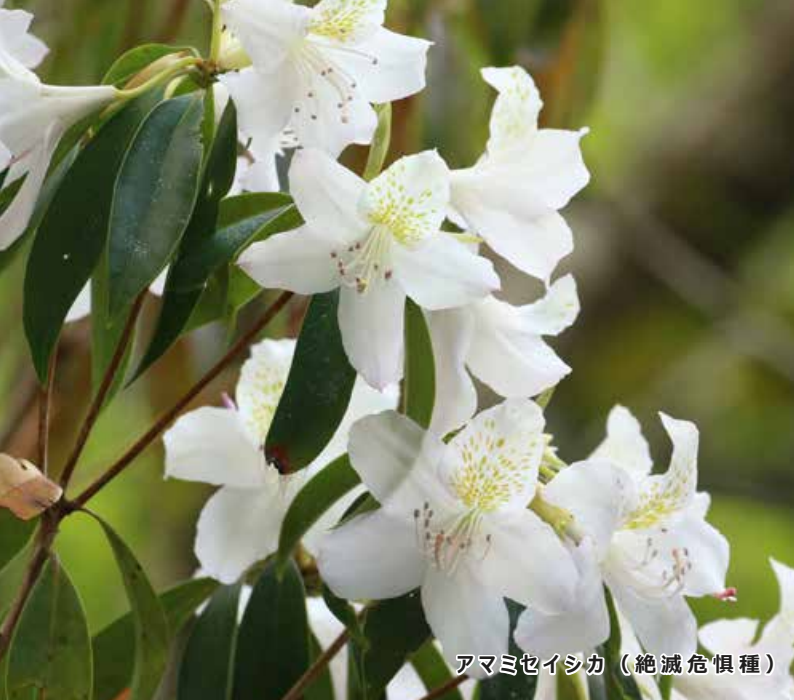
アマミセイシカ（絶滅危惧種）