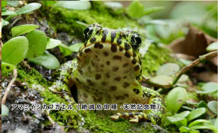
アマミイシカワガエル（絶滅危惧種・天然記念物）