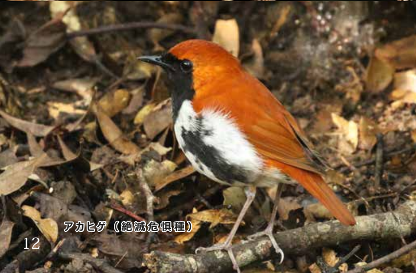
アカヒゲ（絶滅危惧種）