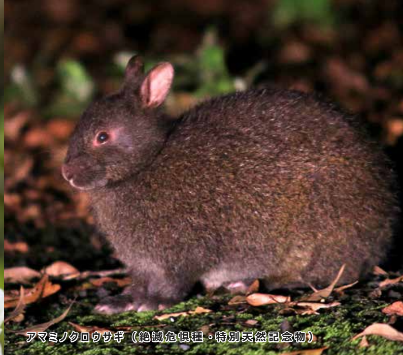
アマミノクロウサギ（絶滅危惧種・特別天然記念物）