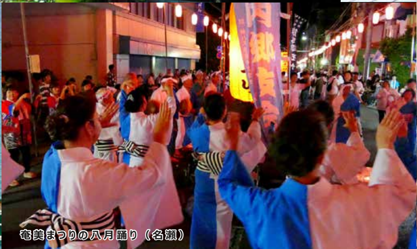
奄美まつりの八月踊り（名瀬）