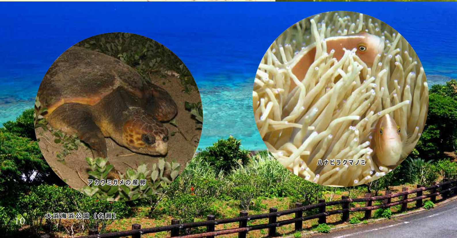
アカウミガメの産卵