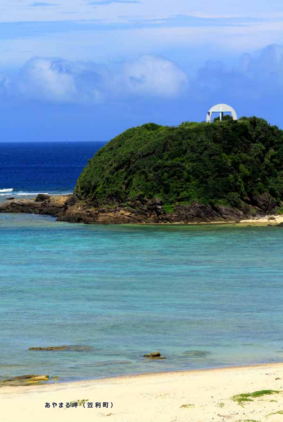
あやまる岬（笠利町）