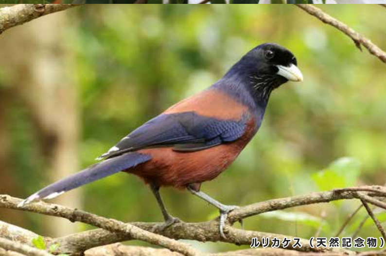
ルリカケス（天然記念物）