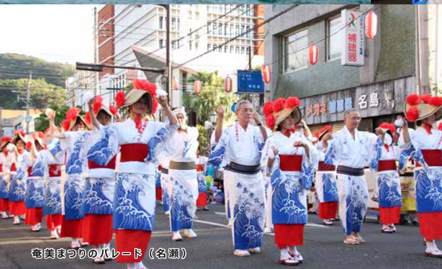
奄美まつりのパレード（名瀬）