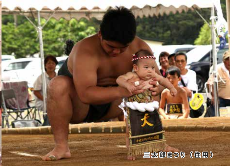
三太郎まつり (住用)