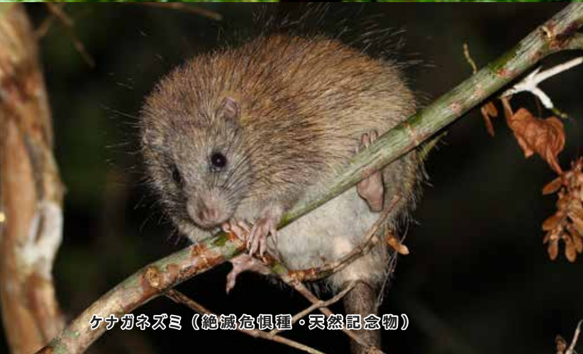
ケナガネズミ（絶滅危惧種・天然記念物）