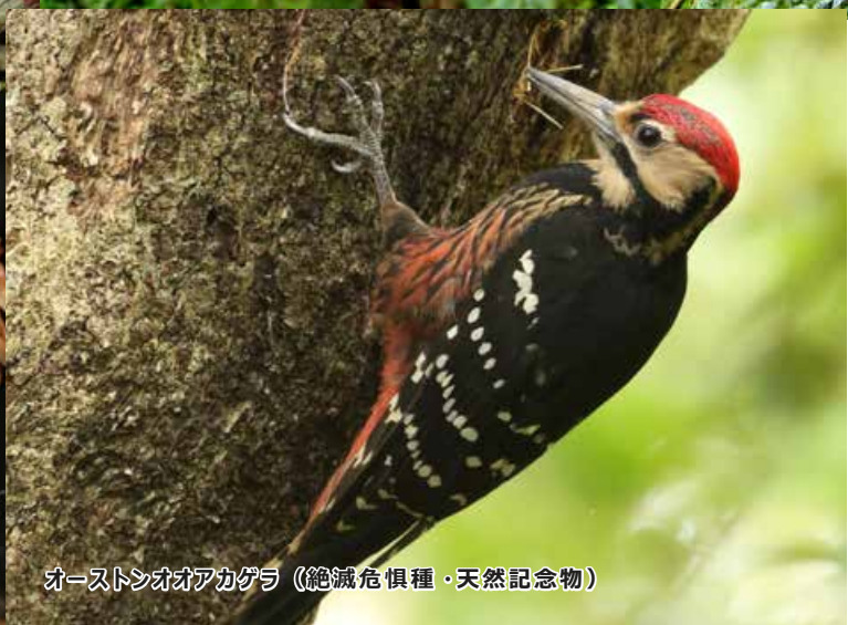
オーストンオオアカゲラ（絶滅危惧種・天然記念物）