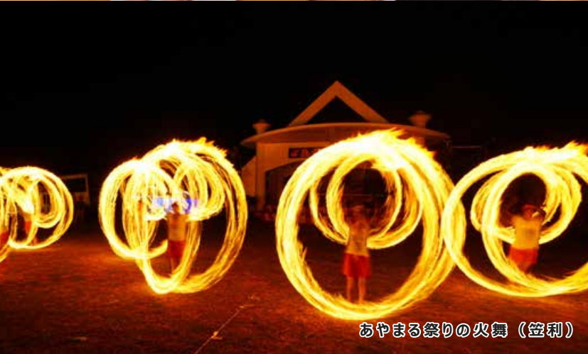
あやまる祭りの火舞 (笠利)