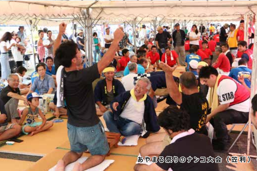
あやまる祭りのナンゴ大会 (笠利)