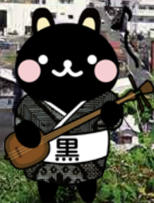
奄美市公式キャラクター コクトくん