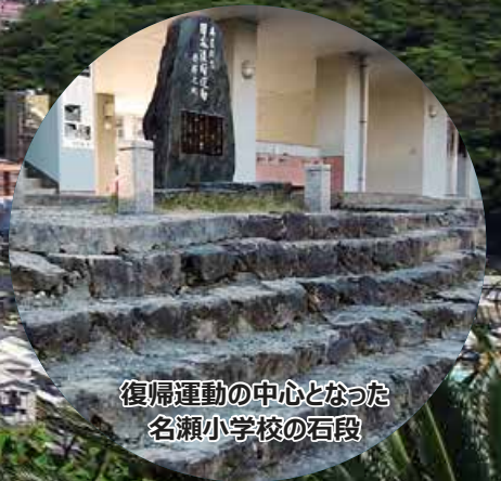
復帰運動の中心となった 名瀬小学校の石段