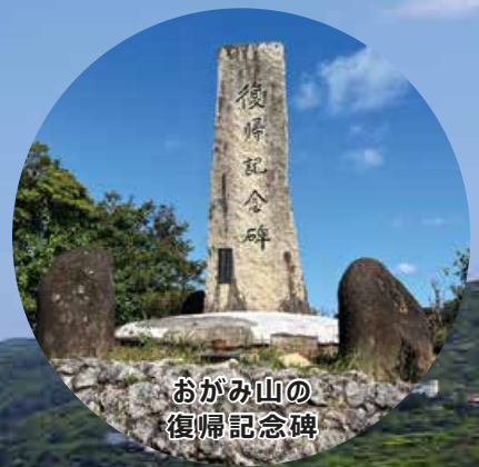
おがみ山の 復帰記念碑