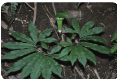
アマミテンナンショウ