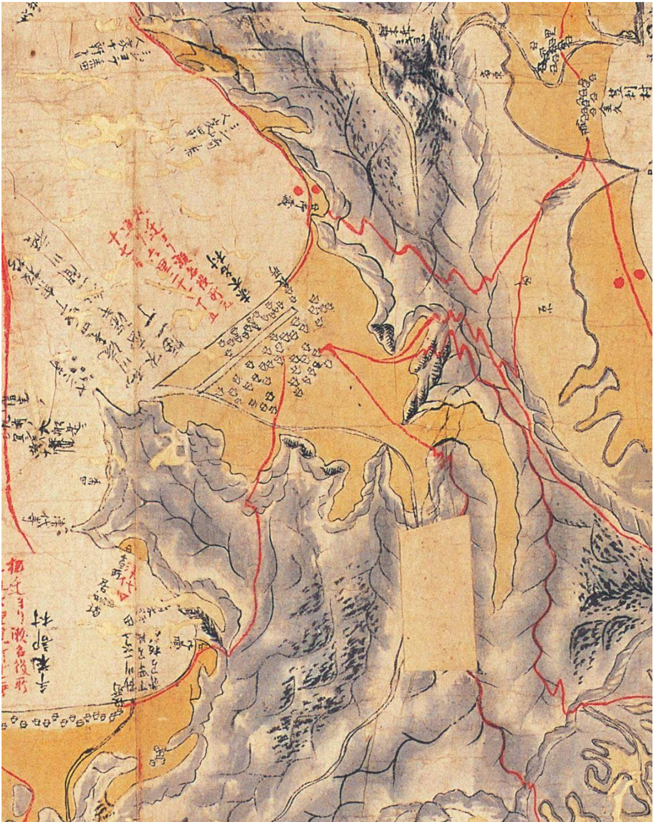
第33図 1851（嘉永4）年～1852（嘉永5）年作成 「大島古図」（鹿児島県立図書館蔵）における赤木名村