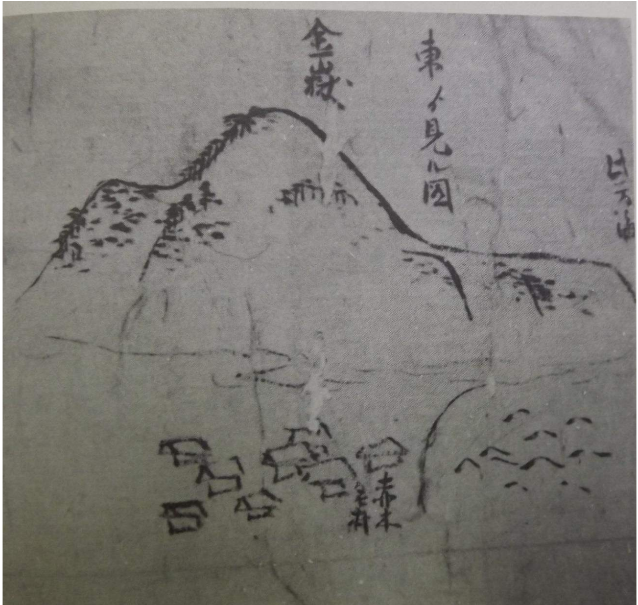
第 34 図 1852 (嘉永 5) 年~1854 (安政元) 年か 名越左原太「絵図方用向書付入」における「赤木名村」 (亀井勝信『奄美大島諸家系譜集』, 1980 年、国書刊行会)